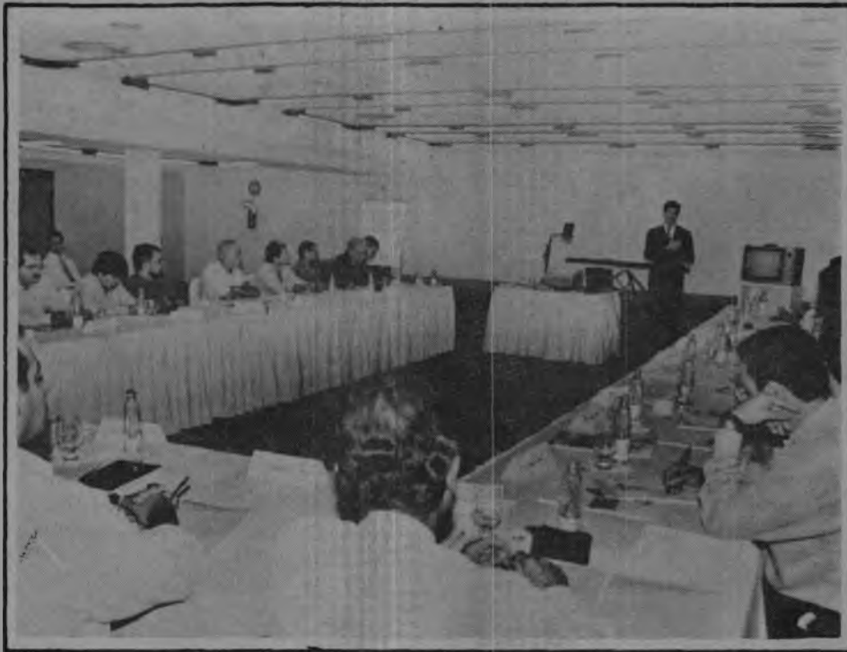
Diretores técnicos de estatais no Fórum de Empresas de Processamento de Dados

Segundo ele, as discussões técnicas trazidas ao encontro abordarão projetos e idéias que produzam tecnologia direcionada a atividade fim das empresas estatais de informática: o usuário do serviço prestado pelo Estado, como acesso à base de dados sobre impostos, veículos, taxas, pavimen-