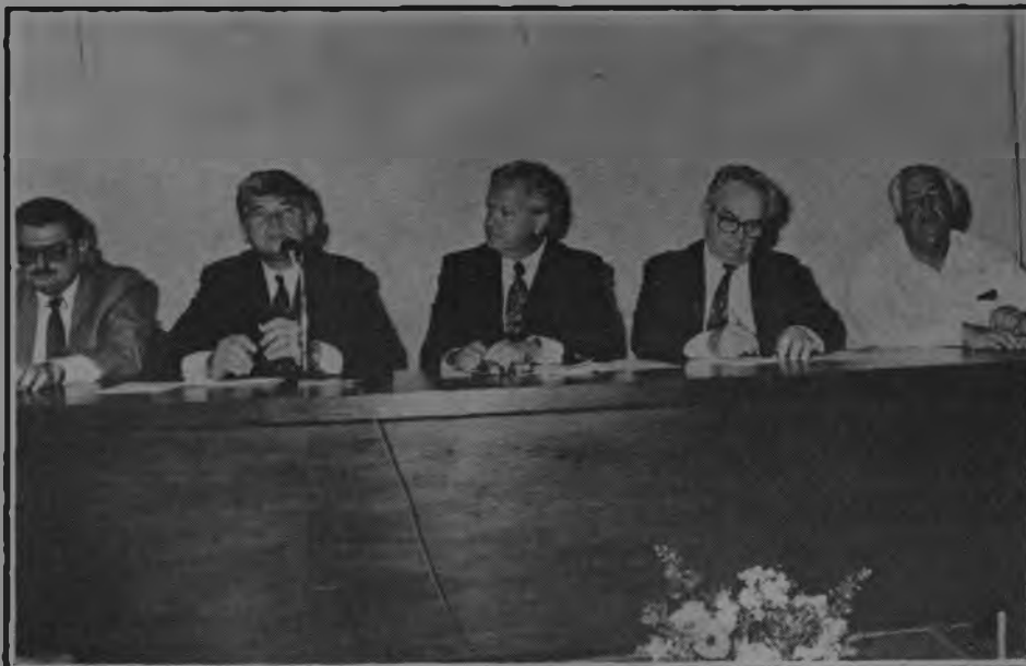
Suruagy presidiu reunião com auditório da Cinal completamente lotado

As autoridades e empresários que superlotara o auditório ouviram palestra sobre “Tecnologia e Desenvolvimento Regional”, proferida pelo presidente da Finep, Lourival Monaco. O secretário Rui Guerra, da Indústria e do Comércio, fez um balanço sobre os empreendimentos que pretendem instalar-se no Estado e enfatizou que o governo vem cumprindo sua parte na busca do caminho do de-